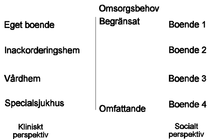
Figur 2. Boende för alla, med varierande form och innehåll.

Efter den lodräta linjen kan personer med handikapp tänkas placerade, med avseende på omfattningen av deras behov av omsorger, med de med begränsade behov högst upp, och de med mer omfattande behov av omsorger längst ned.